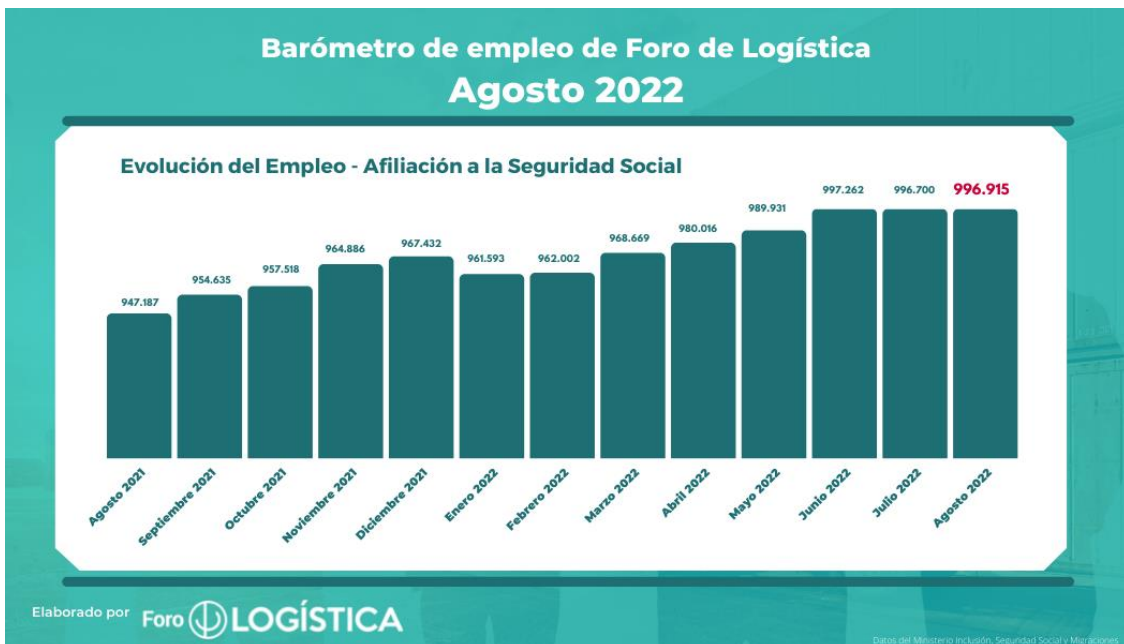
Gráfico 1.- Evolución del empleo en Logística en 2021-2022 (Transporte y almacenamiento)

Este resultado supone que el cambio de tendencia que trajo consigo dicho mes parece haberse consolidado, y aunque la serie oscila en torno a máximos anuales de empleo, el dato del mes de agosto deja entrever unas perspectivas menos favorables para los próximos meses. En suma, la tendencia creciente de la ocupación del sector registrada durante desde el año 2021 ha quedado frenada en seco durante el pasado mes de junio.